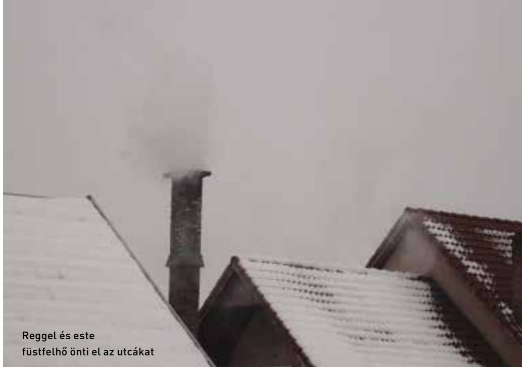
Reggel és este füstfelhő önti el az utcákat

Jobbágyiban a szerződés szerint 995 forintért adunk egy mázsát.