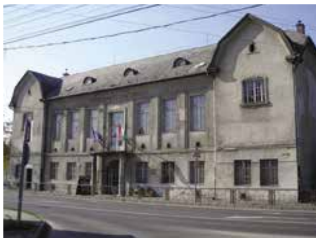
A fóti művelődési ház Pest megyében – nem jut pénz a felújítására

A legnagyobb önkormányzati tömörülés, a Települési Önkormányzatok Országos Szövetsége (TÖOSZ) elnöksége is határozatban mondta ki: támogatja Gomba Község Önkormányzatának kezdeményezését arra vonatkozóan,