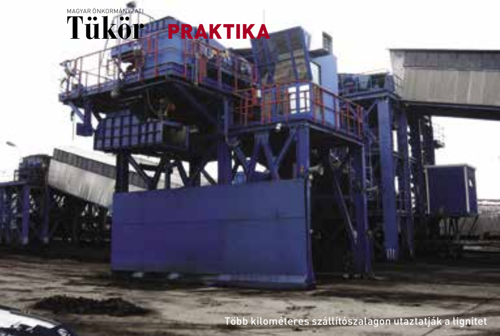
Több kilométeres szállítószalagon utazzatják a lignitet