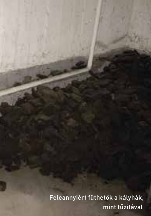
Feleannyiért fűthetők a kályhák, mint tűzifával